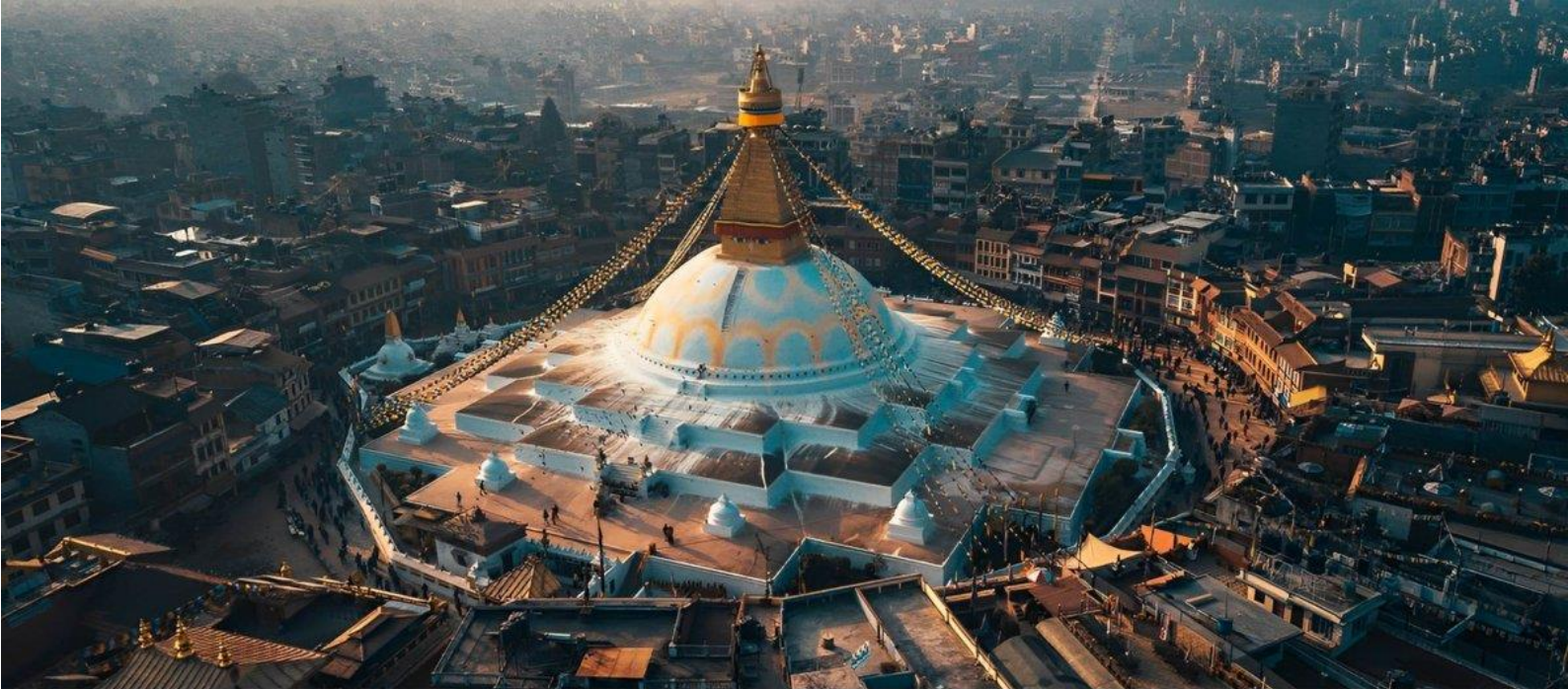
Буддийская ступа Бодунатх в одноименном районе Катманду.

Каждое вращение молитвенного круга эквивалентно чтению мантры, выбитой на нем одиннадцать тысяч раз.